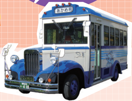
Hop-on, Hop-off Bus